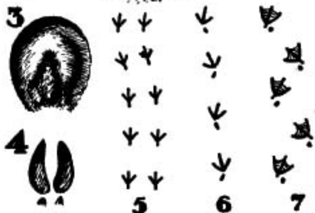
1 : Vélo; 2 : Auto; 3 : Cheval; 4 : Sanglier; 5 : Oiseau souteur; 6 : Oiseau marcheur; 7 : Palmipède (canard).